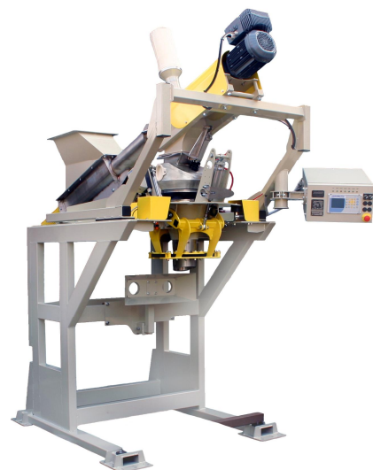
"JANOMATIC B2 VS" pour produits pulvérulents avec bouche d'ensachage étanche Ø180