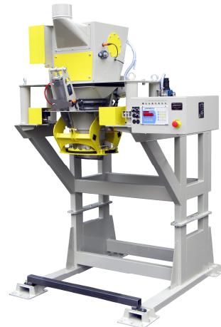
"JANOMATIC B2" pour produits granuleux avec bouche d'ensachage étanche Ø260