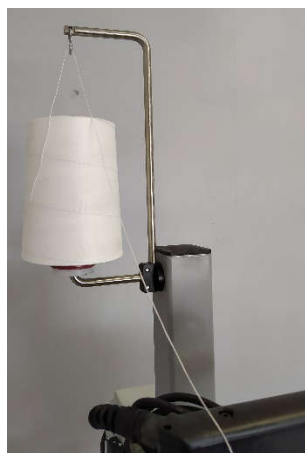
Support de bobine de fil 1Kg