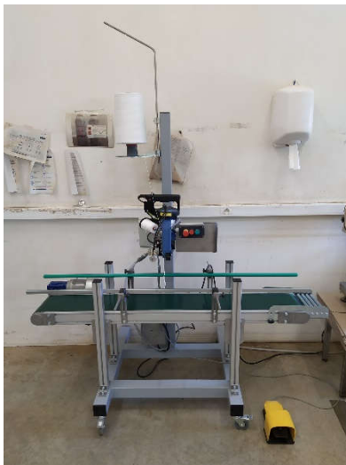
Système PP-LC SEMIC, exemple de configuration

-Le système PP-LC SEMIC est identique au PP mais avec une embase à roulettes élargie comprenant un convoyeur à bande sur variateur avec ridelles de guidage, le convoyeur démarre et s'arrête via la boîte à bouton, cela permet d'avoir un système de couture complet et mobile. Le type de convoyeur est à définir selon la taille de vos sacs.