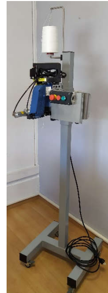
Système PP SEMIC

Alimentation en 220V Monophasé, protection par disjoncteur 2A, Air sec 4/6 Bar.