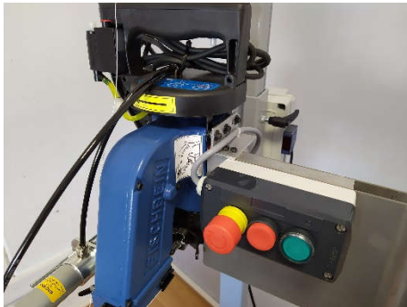
(1) Guide d'entrée en inox & Boite à bouton

Pour toute demande particulière, nous consulter