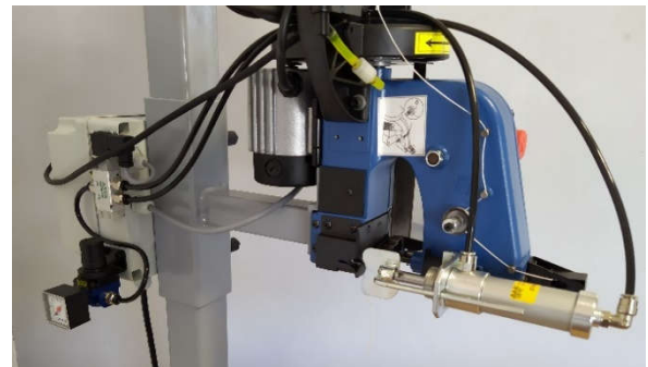
(2) Pousse chainette + commande pneumatique