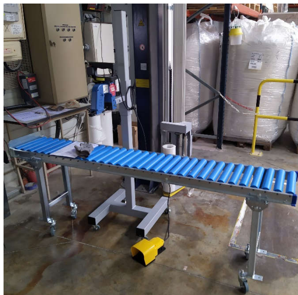
PP-Basic (couture via pédale) + Convoyeur à rouleaux

Le modèle de base se compose d'une machine à coudre Fischbein Modèle F sur un support mural ou une embase à roulettes, la mise en route de la machine se fait via une pédale et la coupe du fil se fait manuellement. Alimentation en 220V Monophasé