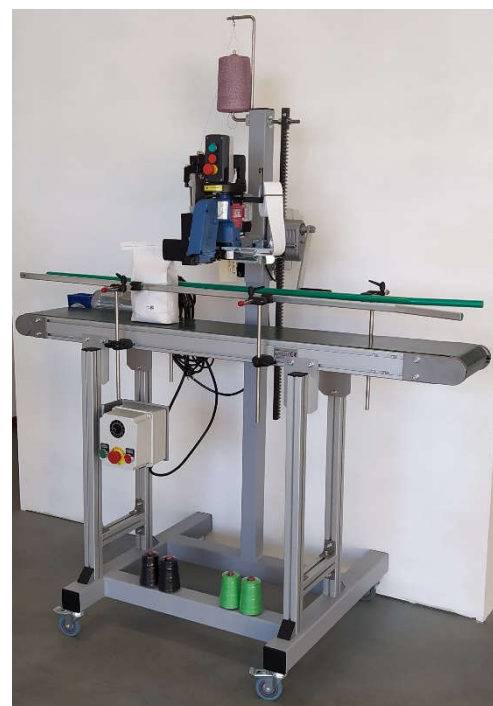
Système PPLC-F50 SEMIC

-Il est possible de remplacer la machine à coudre standard par une dépose de crépon type Fischbein F50 ou F70 (crépon de 50mm ou 70mm) avec un système de coupe pneumatique du crépon.