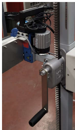
(3) Crémaillère à manivelle